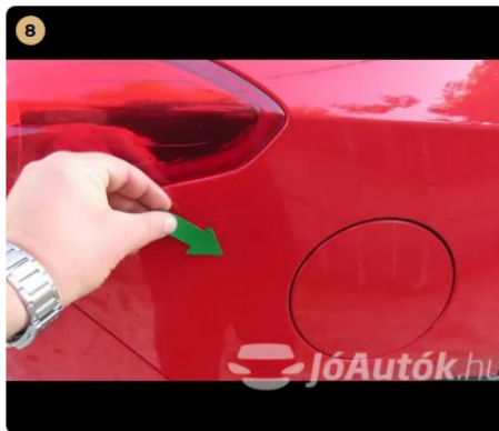
8 Külső karosszéria elemek Jobb hátsó sárvédőn apró horpadás.