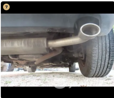
7 Motor A kipufogórendszer és a dobok állapota megfelelő.