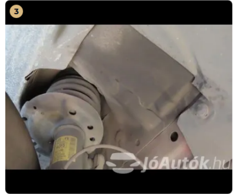
3 Futómű A lengéscillapítón olajfolyás nem észlelhető.