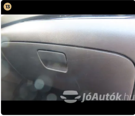
! Kárpitozás és belső burkolatok Kesztyűtartó enyhén karcos.