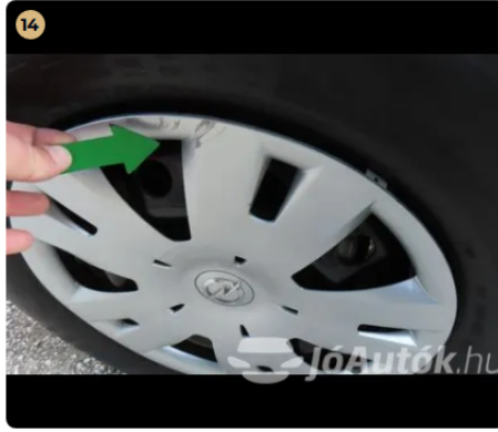
! Felnik Könnnyűfém felnin patkázás nyomai láthatóak. Jobb hátsó dísz tárcsa karcos.