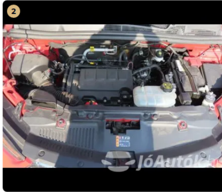
2 Motor Motortérben olajfolyás nem látható.