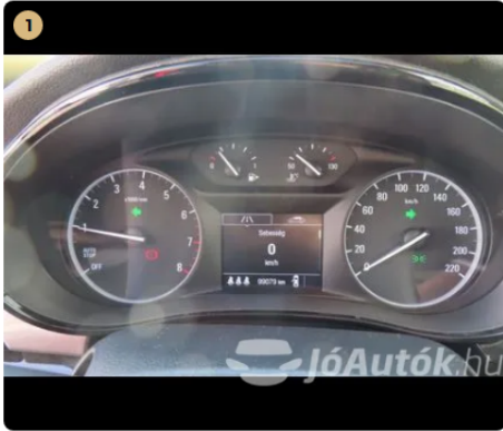
1 Hibakód kiolvasása Számítógépes kiolvasás során nem találtam hibát.