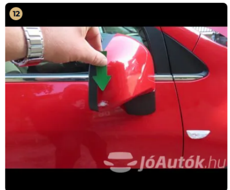
12 Külső karosszéria elemek Jobb első visszapillantó tükör horzsolts.