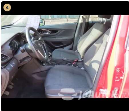
4 Kárpitozás és belső burkolatok A bőr/alcantara kifogástalan állapotú.