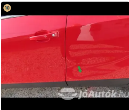
10 Külső karosszéria elemek Bal hátsó ajtón és bal hátsó sárvédőn horpadások vannak.