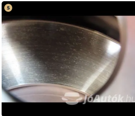
5 Fékrendszer A féktárcsa megfelelő állapotban van.