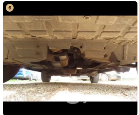
6 Utascella és gyűrődő zónák A padlólemez burkolatán javításra utaló nyomok nem láthatók.