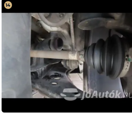
✓ Futómű A féltengelyen zsíros / olajos kicsapódás nem látható.