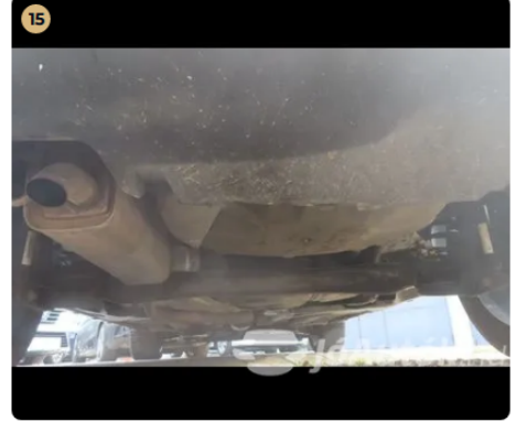
✓ Utascella és gyűrődő zónák A csomagtartó alatti fenéklemezen javításra utaló nyomok nem találhatók.